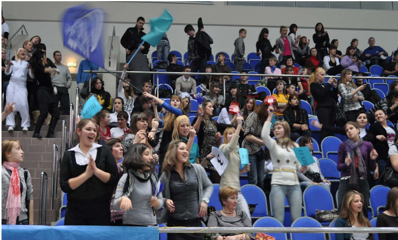
Дворец спорта приветствует ГГХПИ

Тринадцатый раз в комитет по делам молодежи Раменского района проводил праздник российского студенчества, в котором принимал участие наш институт.