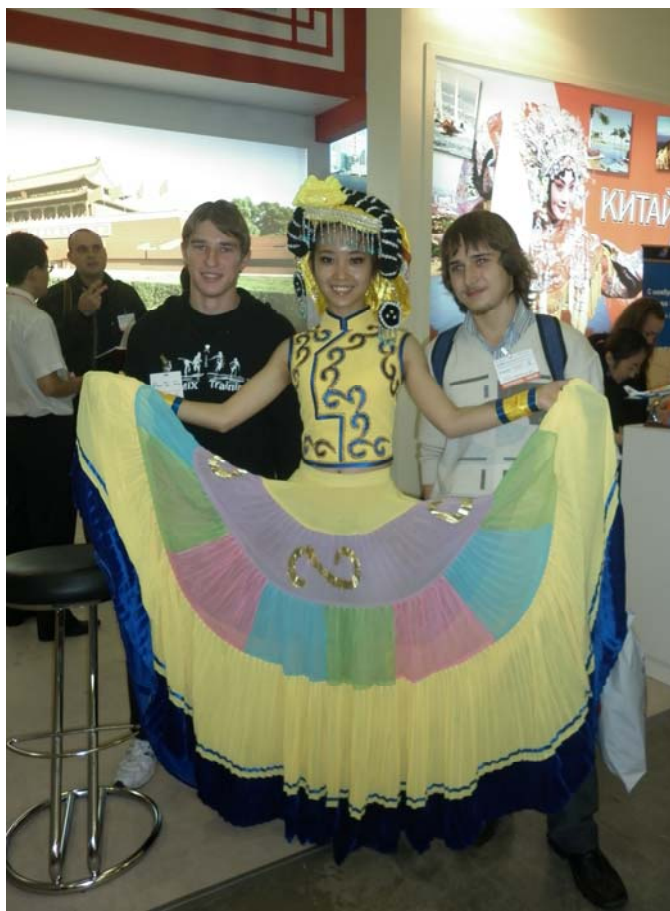
Студенты ф-та «СиТ» с участницей выставки