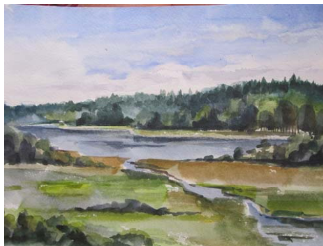
На снимках: Незабываемое лето в Карелии останется на картинах