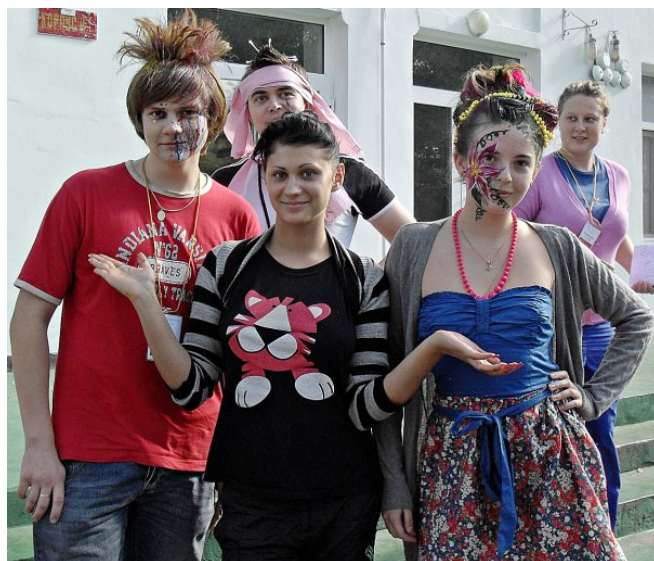
После конкурса причесок – танцевальный

Вскоре выяснилось, что вообще без выдумки и изобретательности в лагере трудно выживать. Свободного времени не было совершенно. День начинался с зарядки, а далее шли сплошные конкурсы: и КВН, и «Агент-007», и футбол, и многое другое. Например, «Бабочка» – веревки, натянутые между деревьями, действительно, напоминали бабочку. Но прелесть еще и в том, что по этим веревкам нужно было пройти (в соответствующем оснащении, конечно), не свалившись вниз. Что такое КВН, объяснять, наверное, не нужно, хотя форма проведения традиционной игры здесь была не совсем обычная. Другое дело – «Агент-007». Мы даже не успели прийти в себя после конкурса причесок, а нужно было уже «добывать» диск, на котором, как выяснилось, музыка для исполнения танца в следующем конкурсе. Нам достался