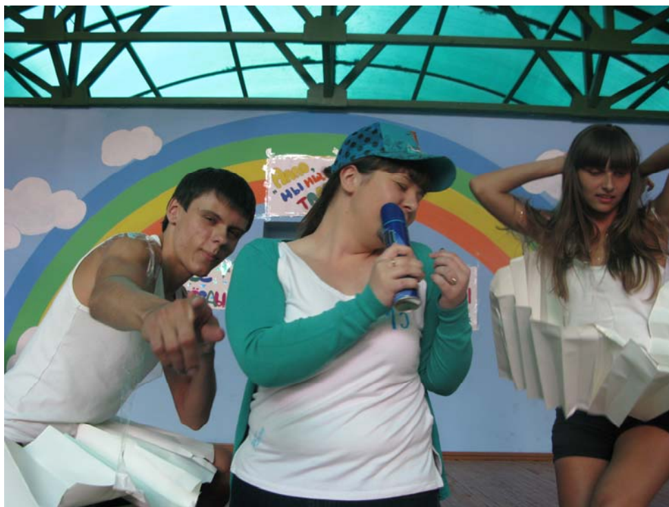
Студенты ГГХПИ – вожатые с артистическими талантами

За лето вожатые набрались много полезного опыта, который, безусловно, пригодится в будущем.