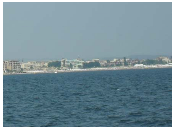
На снимках: виды курорта «Камчия».