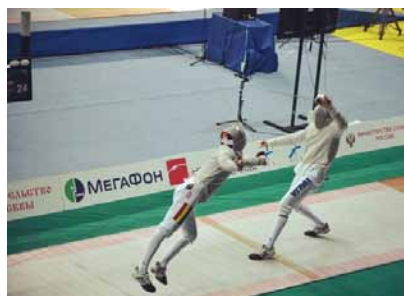
Будем спортивными! стр. 8