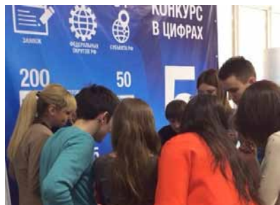
Студентка ГГХПИ будет наблюдателем на ЕГЭ стр. 3