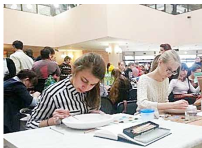
Победители всероссийского форума «Одаренные дети» стр. 6