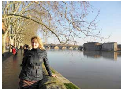
Увидеть Францию и вернуться в Гжель стр. 7