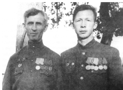
Про наших дедов пишут книги. А что мы оставим потомкам? стр. 5