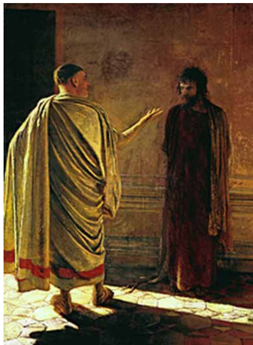
Николай Гё. Что есть истина. Христос и Понтий Пилат