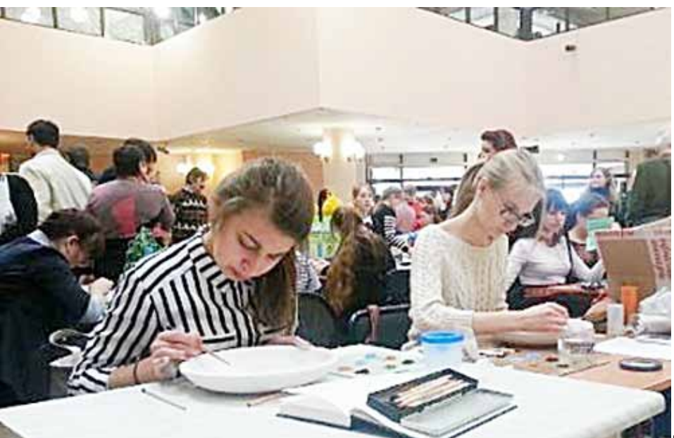
Во время конкурса

Кризис «остановки жизни», который Толстой описал в своей «Исповеди», переживал и я, поэтому мы