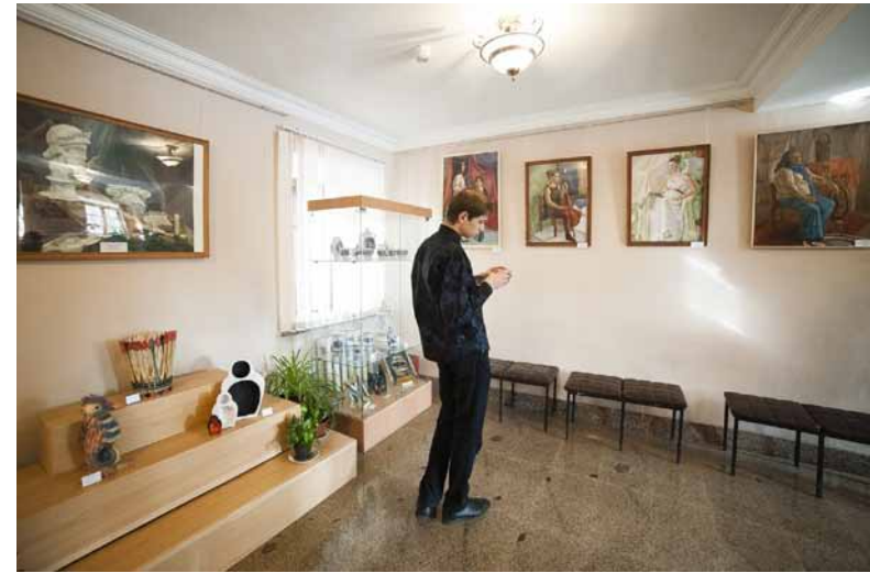
Все готово к встрече со зрителем