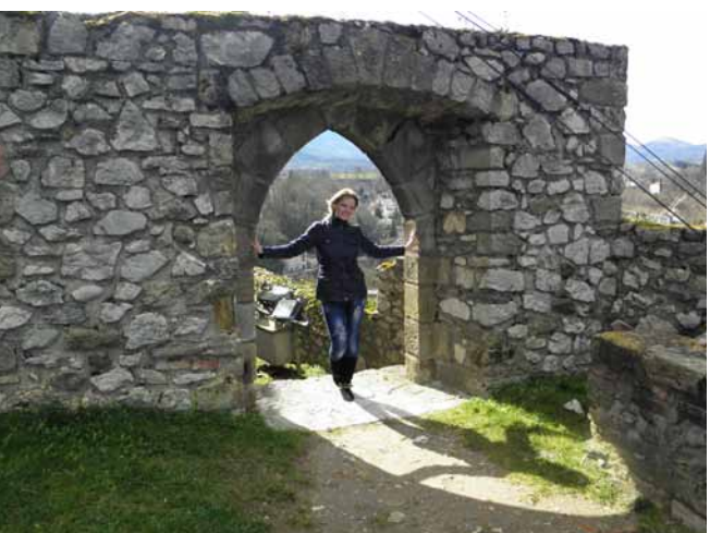
Во Франции много замков