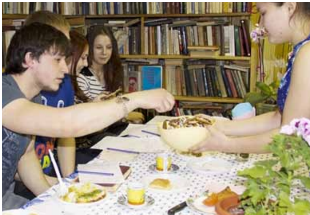
Студенты любят попить чаю

Места в общежитии никогда не пустуют, некоторым приходится жить в комнате вчетвером или вшестером. Мне кажется, что это даже здорово: такое чувство, как будто ты попал в большую семью. Особенно хорошо, конечно, если это сплоченная и дружная семья. Но и это зависит, как показывает опыт, прежде всего, от тебя самого.