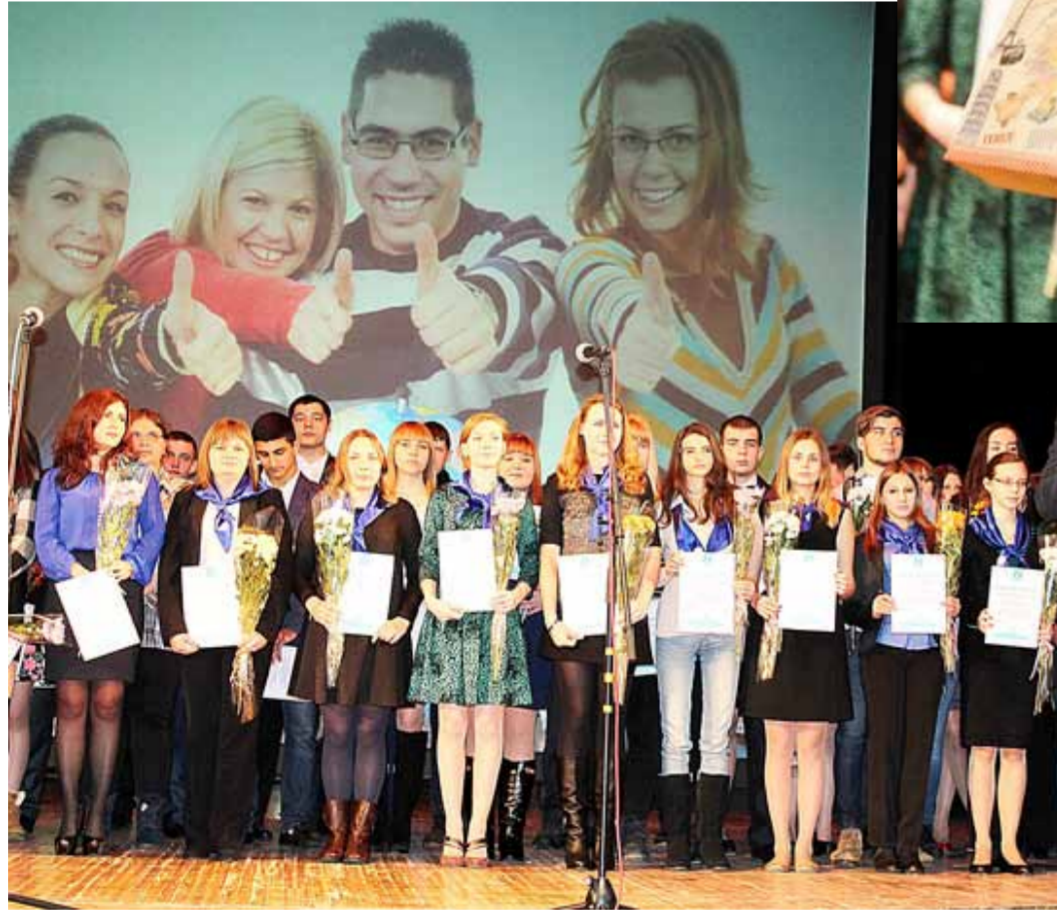
Лучшие студенты учебных заведений Раменского района принимают поздравления