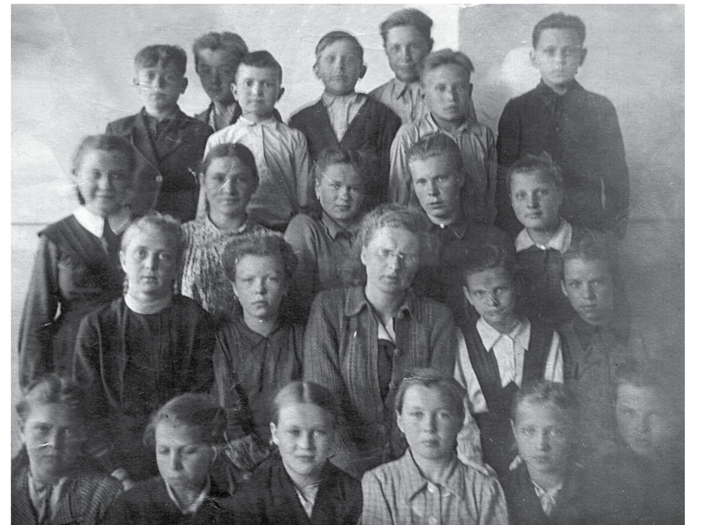
В шестом классе (четвертая в нижнем ряду)