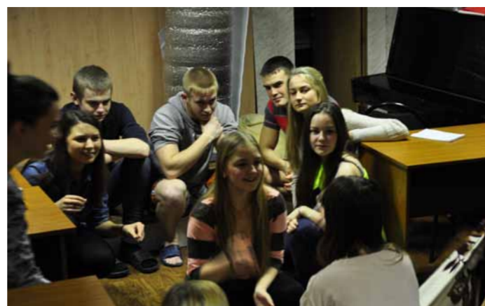
Студсовет обсуждает планы работы