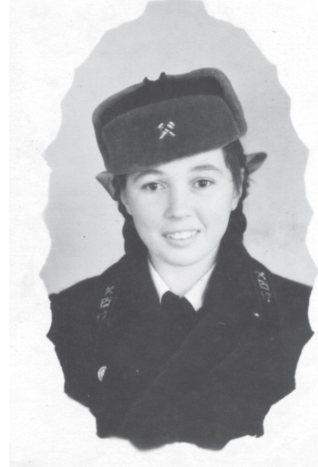
Послевоенная юность – с верой в будущее