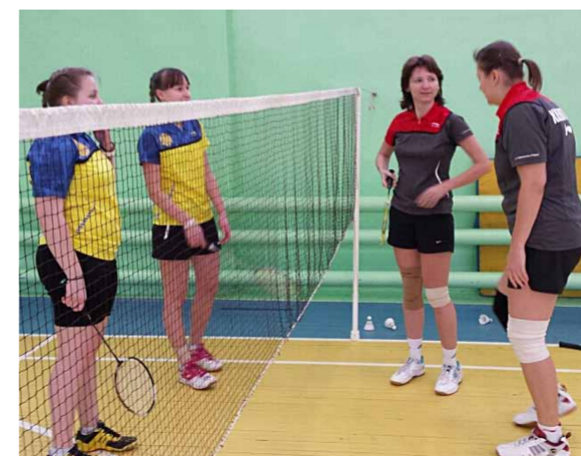
Перед началом игры