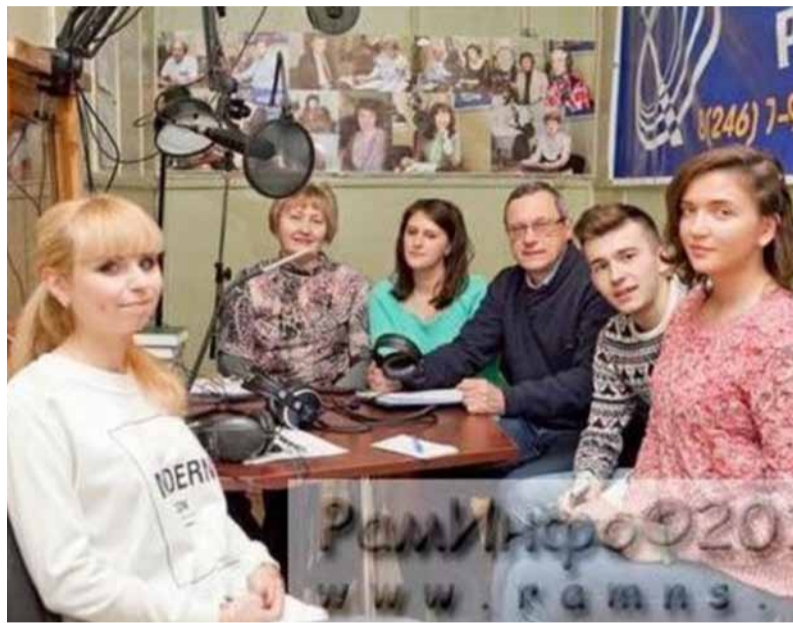
Представители ГГХПИ выступают на Раменском радио в передаче «Актуальное интервью»