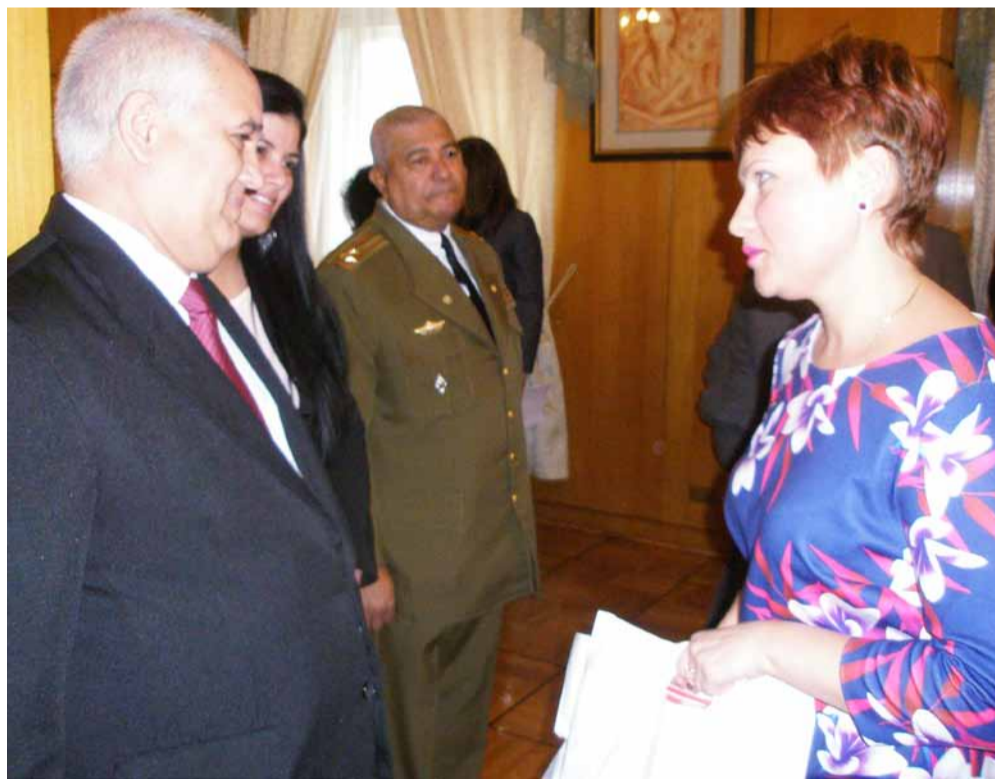
Поздравление Посла Кубы Эмилио Лосады Гарсия от коллектива ГГХПИ

Торжественную часть открыли Чрезвычайный и Полномочный посол Республики Куба в РФ Эмилио Лосада Гарсия и заместитель министра иностранных дел РФ Сергей Алексеевич Рябков.