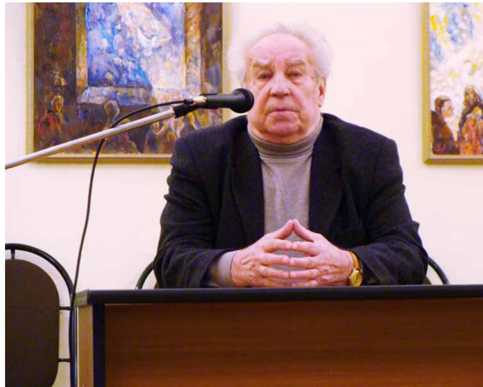
Николай Сергеевич Леонов был переводчиком у Фиделя Кастро