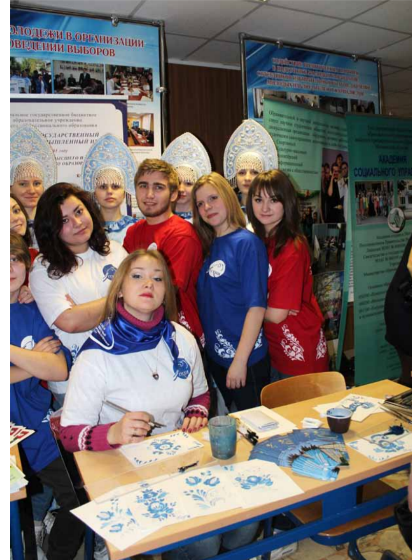
Делегация ГТХПИ на областном празднике, посвященном Дню российского студенчества

Известно, что этот праздник появился 25 (12) января 1755 года и отмечался сначала как день рождения Московского университета (именно в этот день императрица Елизавета подписала указ о его открытии), а затем и как праздник всего российского студенчества. Отмечали День российского студенчества широко и суда по мероприятиям, в которых принимали в этом году участие студенты ГТХПИ, эта традиция сохраняется.