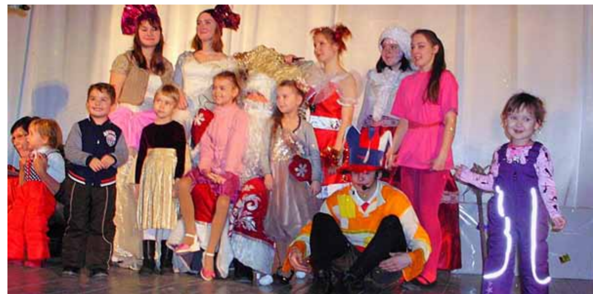
Актеры студенческого театра с маленькими зрителями