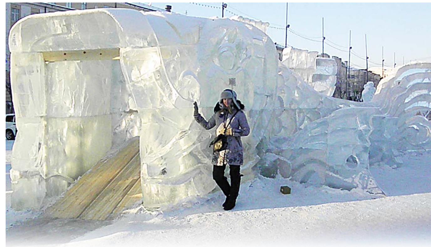
На центральной площади Улан-Удэ