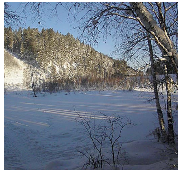
Вот он – Байкал!