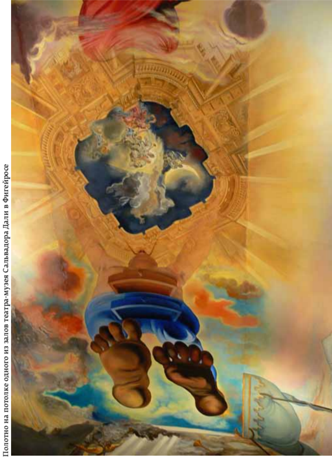
Полотно по технике оптического изобразительного искусства

Множество туристов приезжают в Барселону, чтобы увидеть похожий на выветренную скалу Дом Мила, разукрашенный сталактит Дома Батльо, сказочно затейливый городок Парка Гуэль. С его завершением Антонио Гауди стал самым модным архитектором, «практически неповторимой роскошью». Для буржуа Барселоны он строил дома один необычнее другого. Но главное сокровище – Саграда