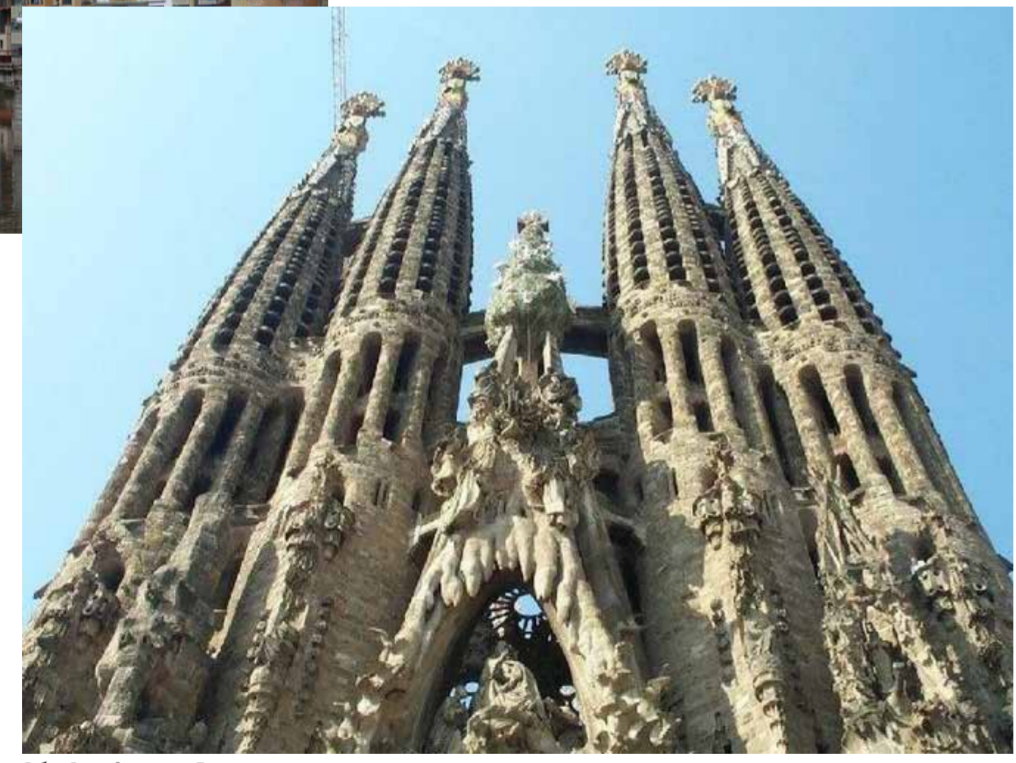
Собор Сагра Фамилия в Барселоне

Он жил отшельником в мастерской на строительной площадке. Мечтал, что Саграда станет «Новым Заветом в архитектуре» со своей сложной системой символики и визуального объяснения тайн веры. Антонио Гауди погиб в 1926 году, попав под трамвай. Умер в больнице для немущих, куда его, неузнанного никем из очевидцев, доставили с места трагедии.