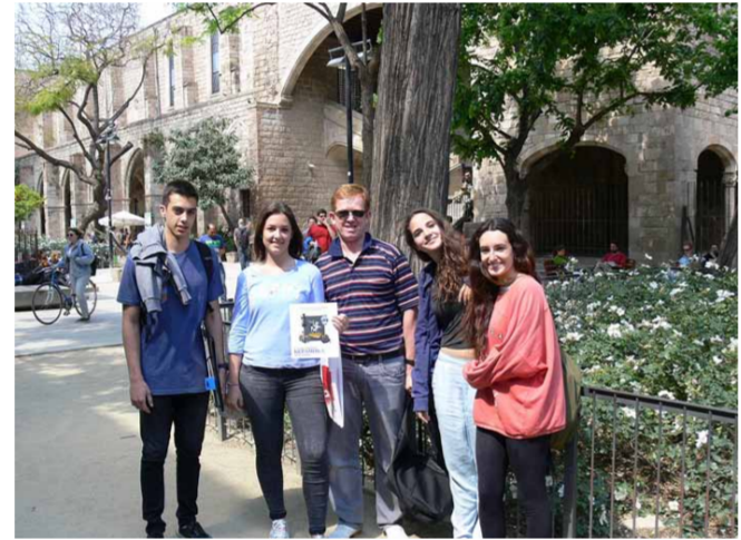
Студенты Школы Массана в Барселоне теперь знакомы с творческими работами преподавателей и студентов Гжелльского института

длин, и был похоронен в недостроенном им соборе. В католическом мире ожидают, что Папа Римский в следующем году