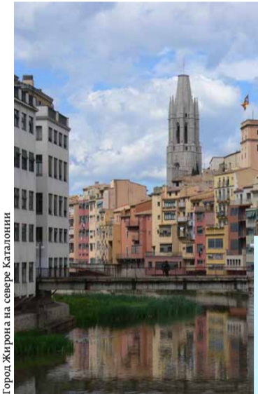
Город Жирона на севере Каталонии

Фамилия, собор Святого Семейства – незавершенный шедевр Антонио Гауди. В 1891, когда Гауди было за 30, общество почитателей Святого Иосифа предложило ему продолжить начатое в 1882 году строительство собора Святого Семейства. Он дал согласие и посвятил этому Собору всю оставшуюся жизнь. В молодости архитектор был рыцарем атеистом, потом стал убежденным католиком и, углубляясь в себя, стал верить в своё мессианское предназначение.